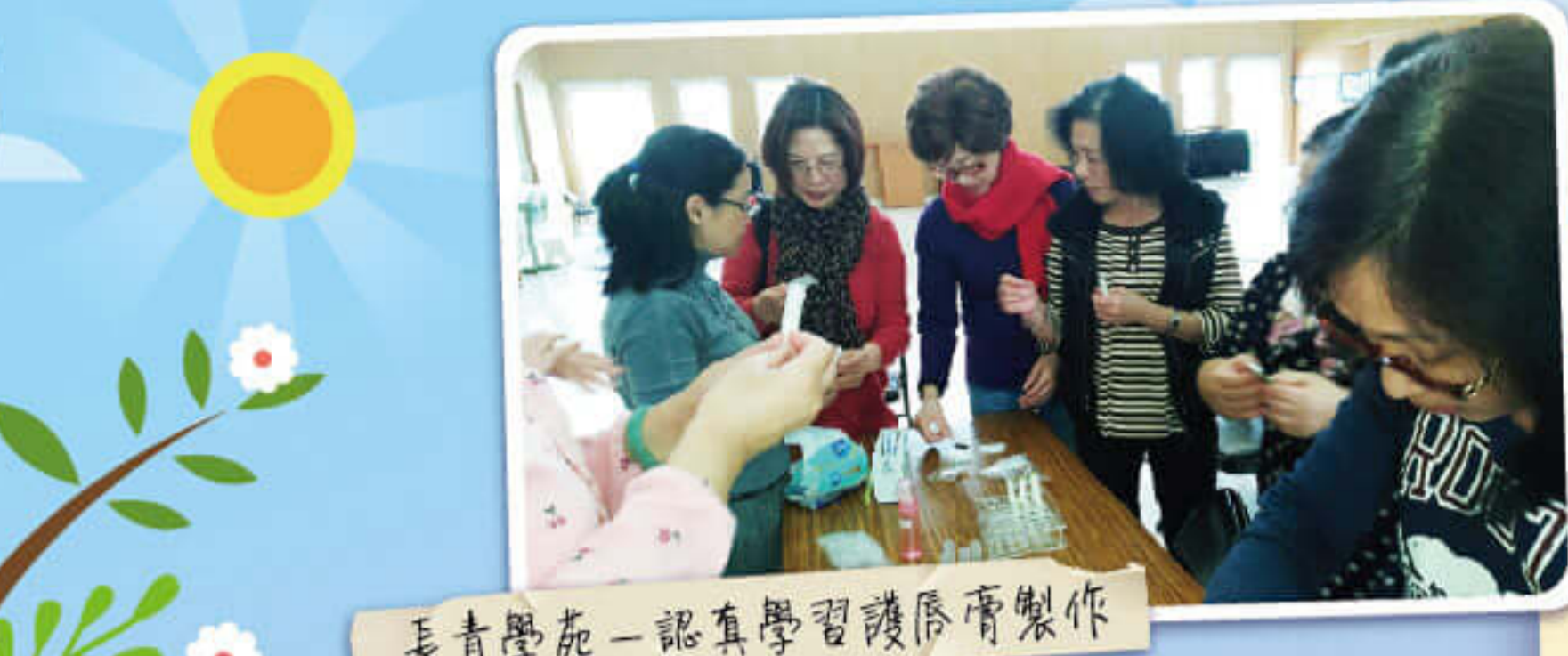
長青學苑-認真學習護理層製作