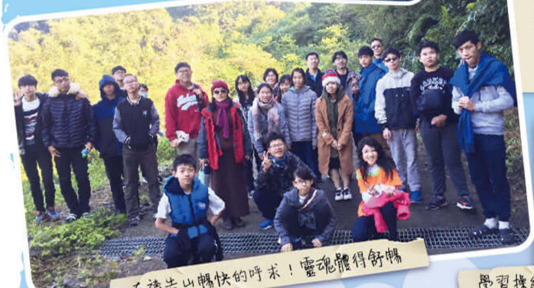
在禱告山暢快的呼求！靈魂體得舒暢