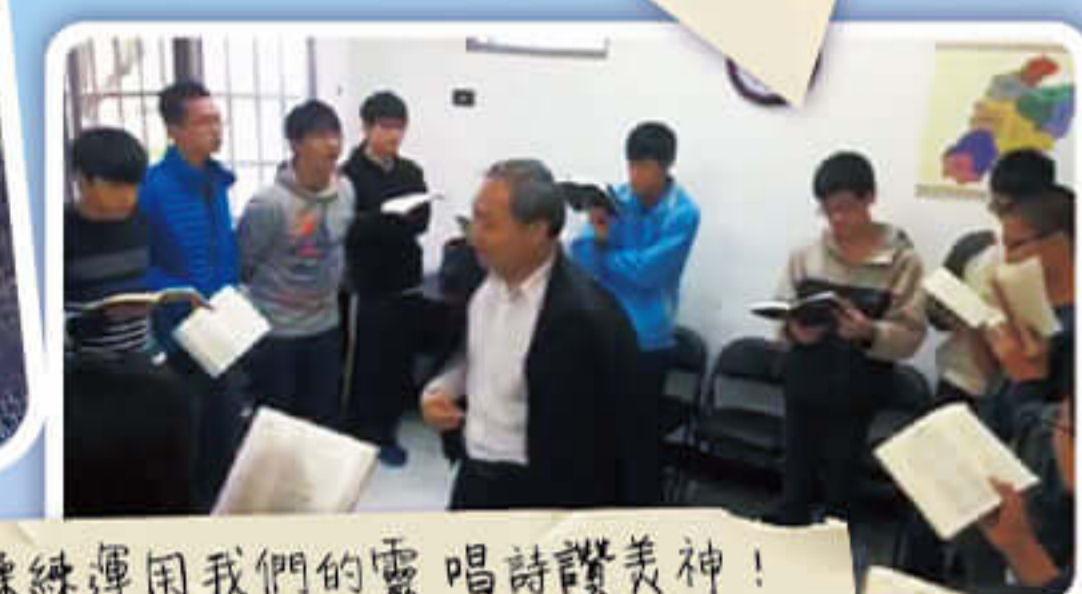
學習操練運用我們的靈唱詩讚美神！