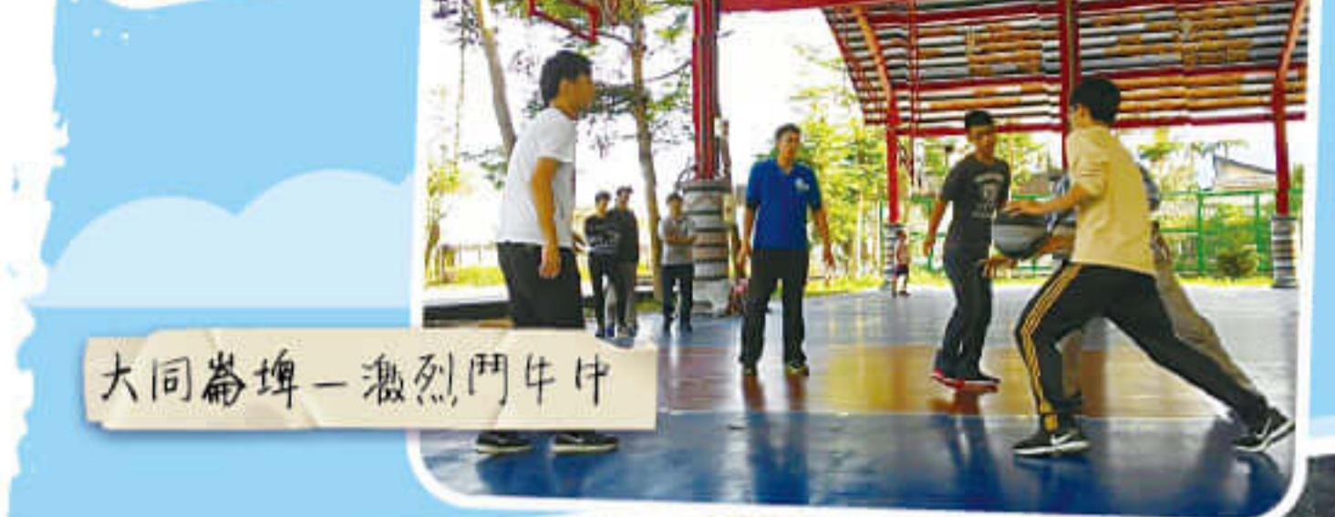
大同崙埤-激烈鬥牛