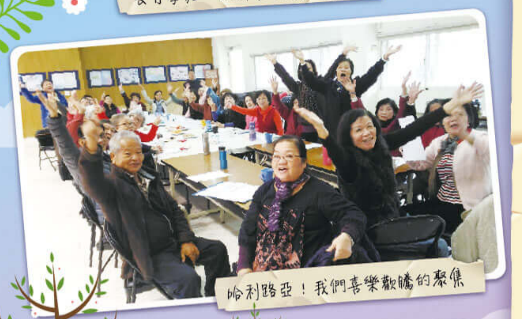
哈利路亞！我們喜樂歡騰的聚會