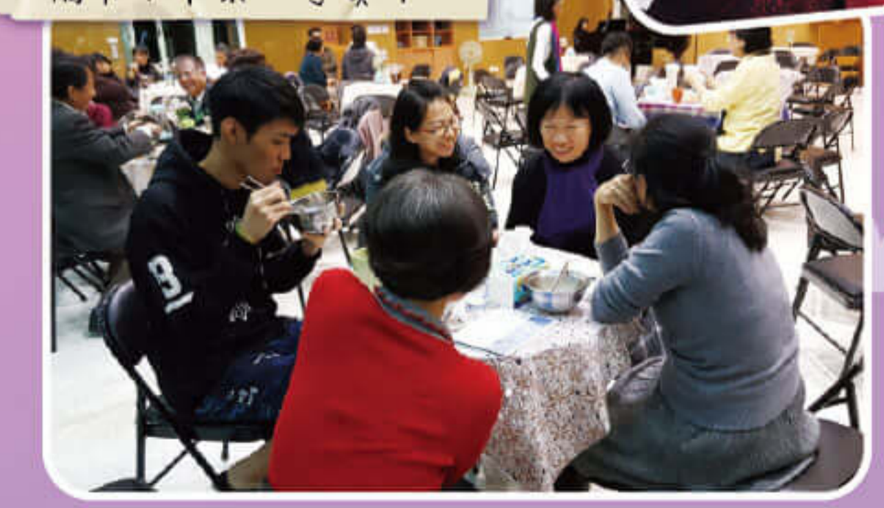
福音下午茶~尋寶中~