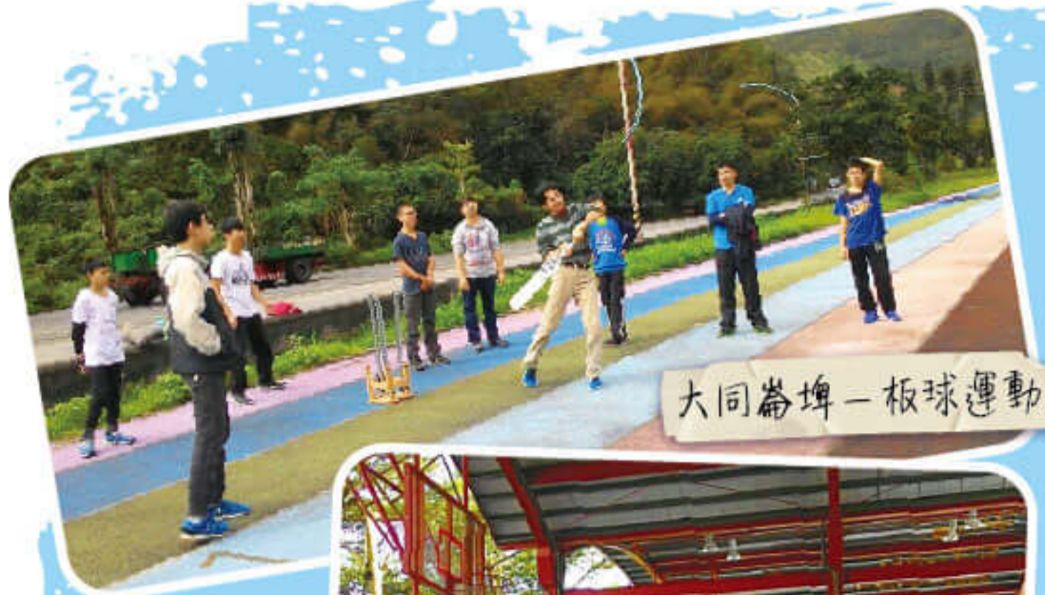
大同崙埤-板球運動